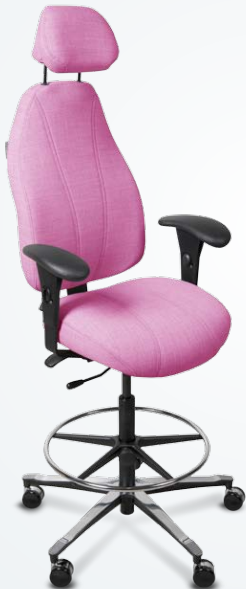
Bilden visar Modell 6000 utrustad som bänkarbetsstol med förlängd gaspelare och fotring.