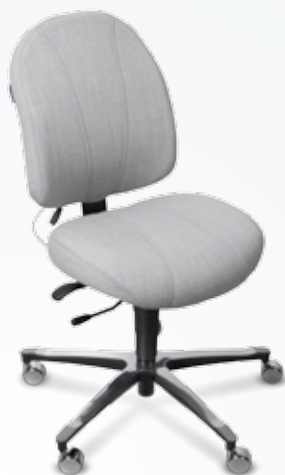
Bilden visar Modell 6000 ESD-anpassad med speciellt ESD-tyg och ESD-hjul i zink för skydd mot statisk elektricitet.