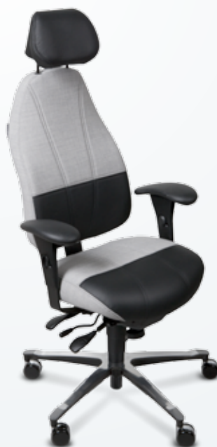
Bilden visar Modell 4000 förstärkt till 24 timmars-stol med skinnförstärkning som tillval.